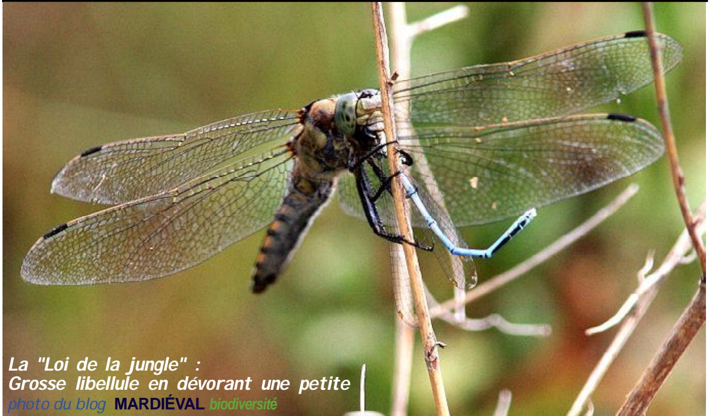
La "Loi de la jungle" : Grosse libellule en dévorant une petite

DANS LES MÉANDRES CACHÉS DES AFFAIRES LOCALES